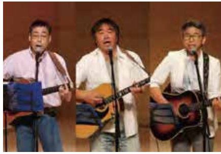
①県北フォークソング倶楽部